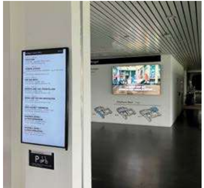
Digital signage stroomt door uit Salesforce.