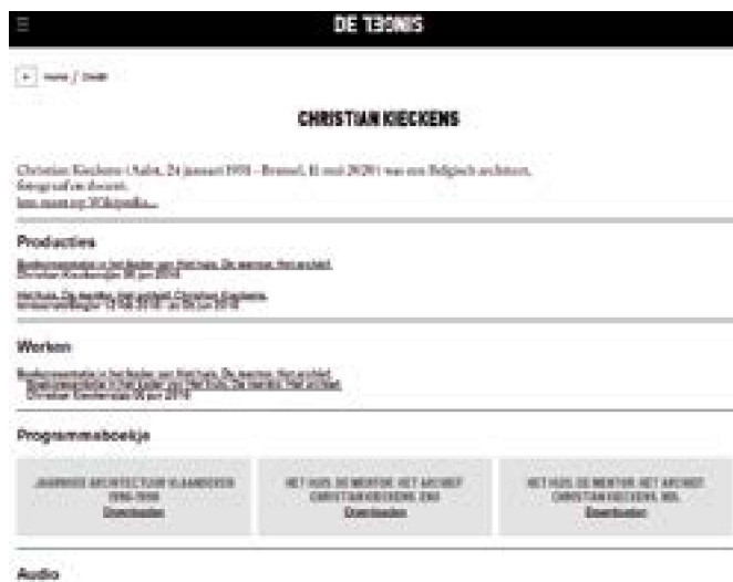
Screenshot credit met informatie uit Wikipedia op website DE SINGEL.